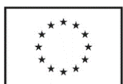
Finansuojama Europos Sąjungos

Kiekviename viešame dokumente, informacijos arba viešinimo produkte arba veikloje ir komunikacijoje su tiksline grupe, spauda arba visuomene bei ženklinant įrangą turi likti tik du privalomi elementai: a) ES vėliava; b) užrašas apie ES finansavimą „Finansuojama Europos Sąjungos“ / “Financed by the European Union”. Programos logotipas nebebus naudojamas.